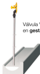
Válvula VRH-3 en gestación .

Ø1/2" · Largo: 1,50 m Código: U0121200-ARG